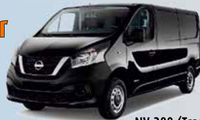
NV 300 (Transport L)