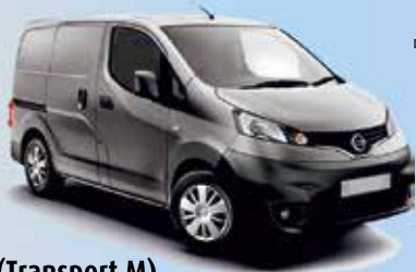
NV 200 (Transport M)