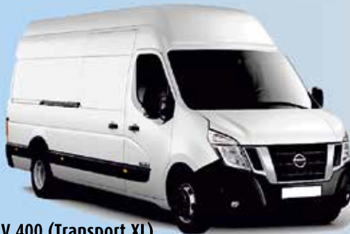
NV 400 (Transport XL)