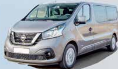
NV 300 (9-Sitzer)