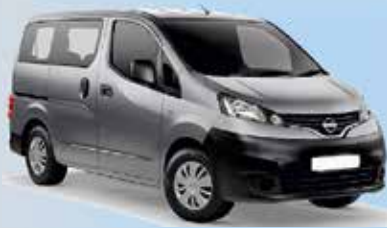
NV 200 (7-Sitzer)